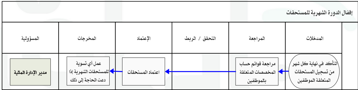
شكل رقم / ٥

يوضح المخطط البياني التالي ( شكل رقم/٥) طريقة تسلسل العمل لإقفال الدورة الشهرية للمستحقات: